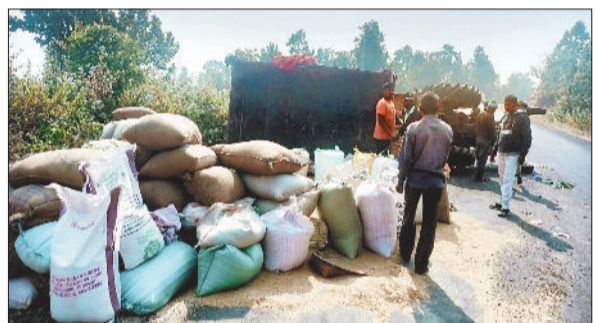
सड़क पर पलटा ट्रेक्टर।