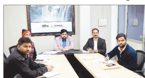
वीडियो कॉन्फ्रेंसिंग में उपस्थित अधिकारी।

श्री साय 25 दिसंबर को पूर्व प्रधानमंत्री एवं भारत रत्न अटल बिहारी वाजपेयी के जन्म दिवस पर पूरे प्रदेश में सुशासन दिवस के रूप में मनाने के निर्देश दिए। वहीं किसानों को वर्ष 2014-15 एवं 2015-16 का बकाया धान का बोनस राशि वितरण भी किया